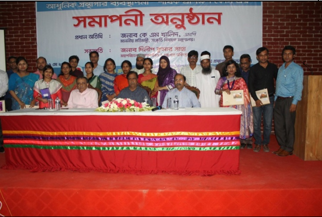
এ্যাডভান্সড আরকাইভাল রেকর্ড ম্যানেজমেন্ট এবং আধুনিক গ্রন্থাগার ব্যবস্থাপনা শীর্ষক পেশাগত প্রশিক্ষণের সমাপনী অনুষ্ঠানে সংস্কৃতি বিষয়ক মন্ত্রণালয়ের প্রতিমন্ত্রী জনাব কে এম খালিদ, এম.পি সনদ বিতরণ করেন।