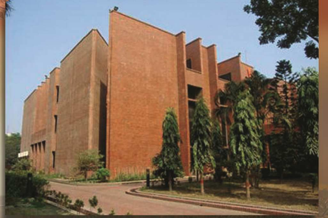
জাতীয় গ্রন্থাগার ভবন