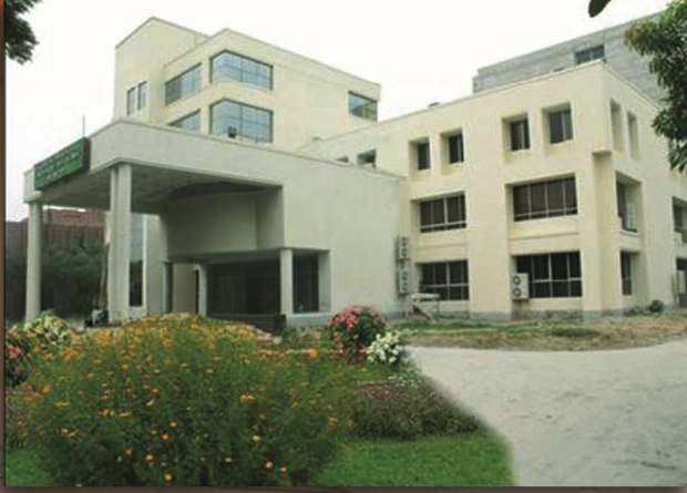
জাতীয় আর্কাইভস ভবন