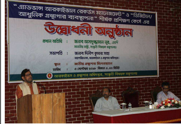
এ্যাডভান্সড আরকাইভাল রেকর্ড ম্যানেজমেন্ট এবং আধুনিক গ্রন্থাগার ব্যবস্থাপনা শীর্ষক পেশাগত প্রশিক্ষণের উদ্বোধন করেন সংস্কৃতি বিষয়ক মন্ত্রণালয়ের মাননীয় মন্ত্রী জনাব আসাদুজ্জামান নূর, এমপি।