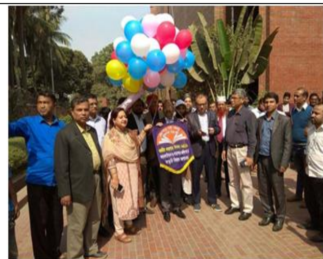
৫ ফেব্রুয়ারি ২০১৯ জাতীয় গ্রন্থাগার দিবসের উদ্বোধন।