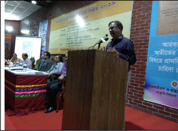
১৬ জুন অনুষ্ঠিত সেমিনারে প্রধান অতিথির বক্তৃতা করছেন সংস্কৃতি বিষয়ক মন্ত্রণালয়ের মাননীয় প্রতিমন্ত্রী জনাব কে এম খালিদ, এমপি।