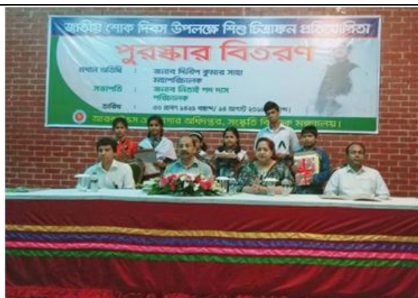
জাতীয় শোক দিবস উপলক্ষে শিশু চিত্রাঙ্কন প্রতিযোগিতায় বিজয়ীদের পুরস্কার প্রদান অনুষ্ঠান।