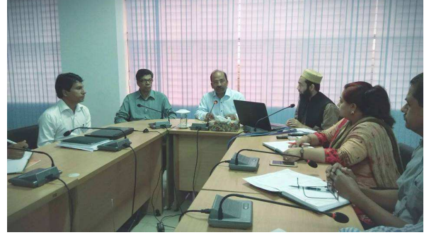
২৬ জুলাই ২০১৮ তারিখ আরকাইভস ও গ্রন্থাগার অধিদপ্তরের কর্মকর্তা ও কর্মচারীদের ই-ফাইল বিষয়ক আভ্যন্তরীণ প্রশিক্ষণ।