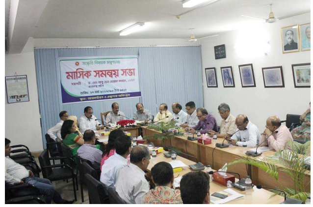
সংস্কৃতি বিষয়ক মন্ত্রণালয়ের মার্চ ২০১৯ মাসের মাসিক সমন্বয় সভা আরকাইভস ও গ্রন্থাগার অধিদপ্তর আয়োজন করে।