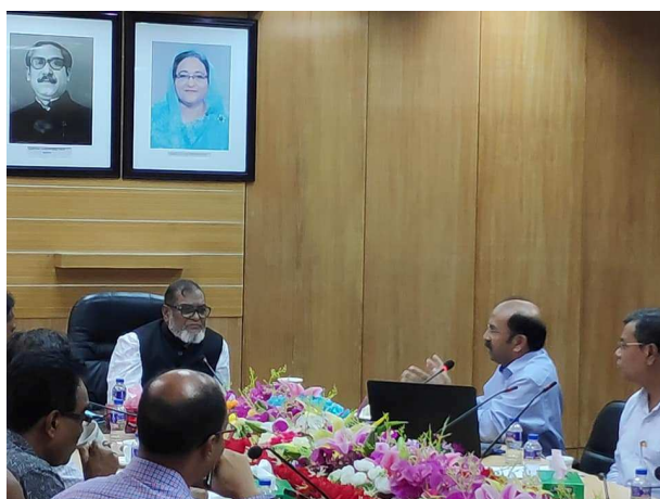
আরকাইভাল নথিপত্র সংরক্ষণের বিষয়ে সচেতনতা সৃষ্টিকল্পে মুক্তিযুদ্ধ বিষয়ক মন্ত্রণালয়ের সঙ্গে মতবিনিময় সভা অনুষ্ঠিত হয়।