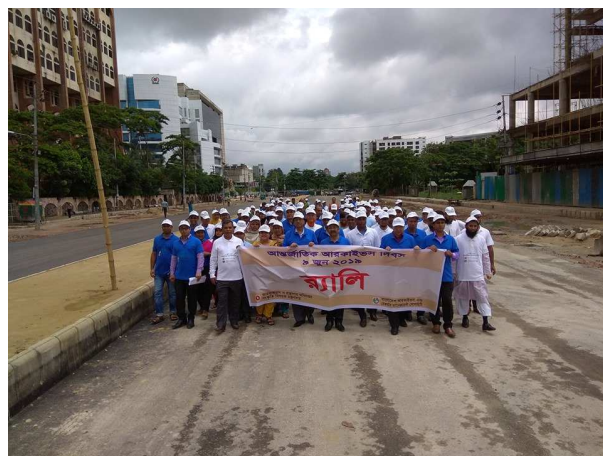
আন্তর্জাতিক আরকাইভস দিবস ২০১৯ উপলক্ষে র্যালি।