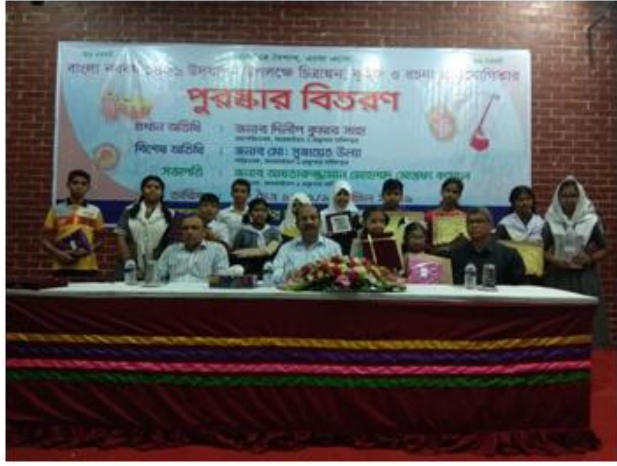
১লা বৈশাখ উপলক্ষে চিত্রাঙ্কন ও রচনা প্রতিযোগিতার পুরস্কার বিতরণ।