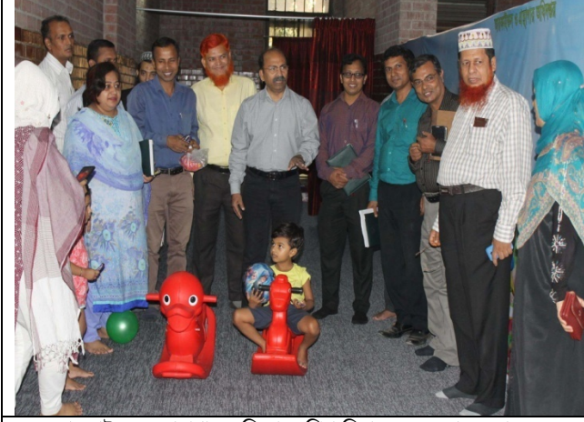
আরকাইভস ও গ্রন্থাগার অধিদপ্তরে শিশু দিবায়ত্র কেন্দ্র চালু করা হয়।