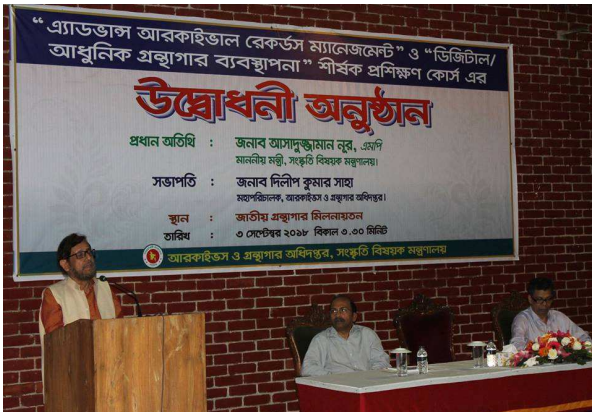
প্র্যাডভান্স আরকাইভ্যাল রেকর্ড ম্যানেজমেন্ট এবং আধুনিক গ্রন্থাগার ব্যবস্থাপনা শীর্ষক পেশাগত প্রশিক্ষণের উদ্বোধন করেন সংস্কৃতি বিষয়ক মন্ত্রণালয়ের মাননীয় মন্ত্রী জনাব আসাদুজ্জামান নূর, এমপি।