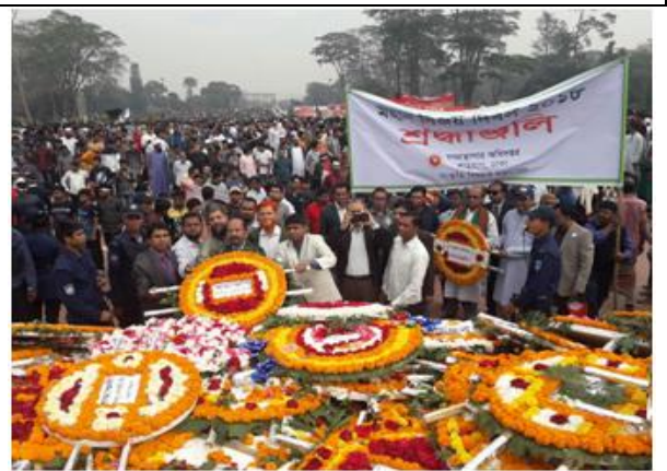
মহান বিজয় দিবস ২০১৮ উপলক্ষে সাভার জাতীয় স্মৃতিসৌধে শ্রদ্ধাজলি অর্পণ।