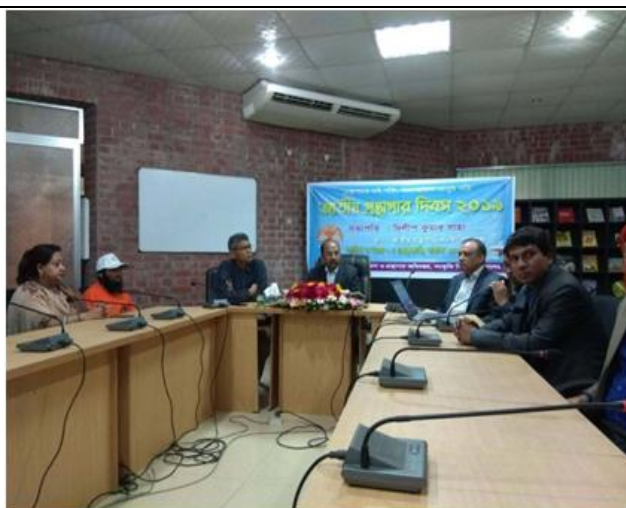
জাতীয় গ্রন্থাগার দিবস উপলক্ষে আয়োজিত সেমিনার।