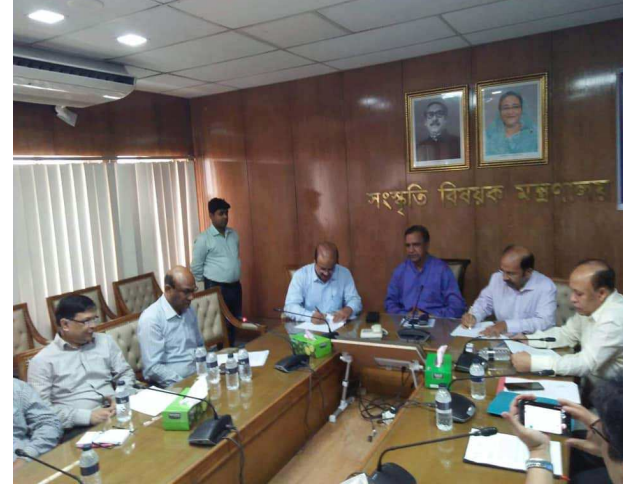
বার্ষিক কর্মসম্পাদন চুক্তি স্বাক্ষর অনুষ্ঠান।