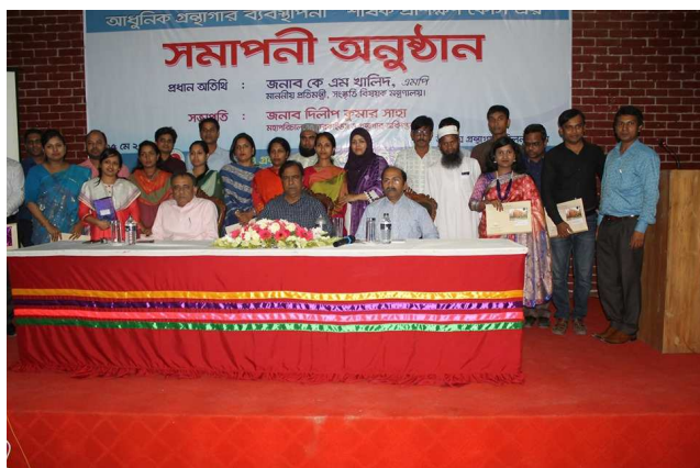
এ্যাডভান্সড আরকাইভ্যাল রেকর্ড ম্যানেজমেন্ট এবং আধুনিক গ্রন্থাগার ব্যবস্থাপনা শীর্ষক পেশাগত প্রশিক্ষণের সমাপনী অনুষ্ঠানে প্রশিক্ষণার্থীদের সংঙ্গে সংস্কৃতি বিষয়ক মন্ত্রণালয়ের প্রতিমন্ত্রী জনাব কে এম খালিদ, এম পি ।