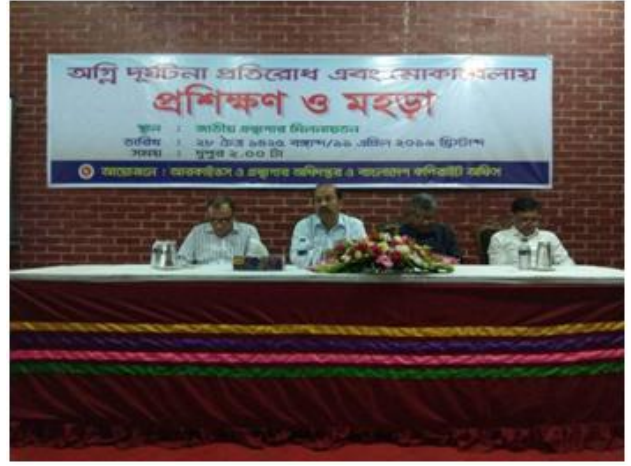
১১ এপ্রিল ২০১৯ তারিখে অগ্নি দুর্ঘটনা প্রতিরোধ এবং মোকাবেলায় প্রশিক্ষণ ও মহড়া অনুষ্ঠিত হয়।