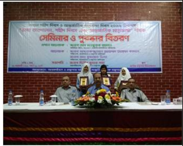
আন্তর্জাতিক মাতৃভাষা দিবস উপলক্ষে সেমিনার ও রচনা প্রতিযোগিতার পুরস্কার বিতরণ।