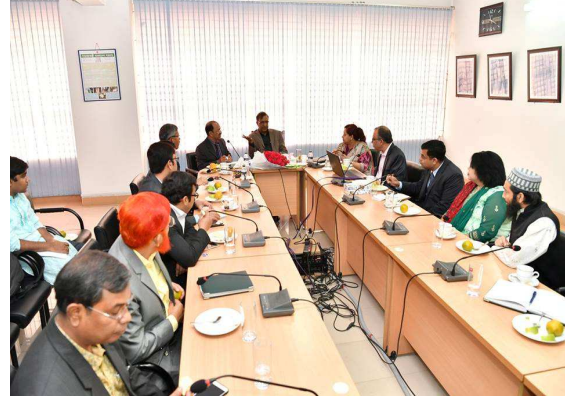
আরকাইভস ও গ্রন্থাগার অধিদপ্তরের কর্মকর্তাদের সঙ্গে সংস্কৃতি বিষয়ক মন্ত্রণালয়ের মাননীয় প্রতিমন্ত্রী জনাব কে এম খালিদ এম পি মহোদয়ের মতবিনিময় সভা।