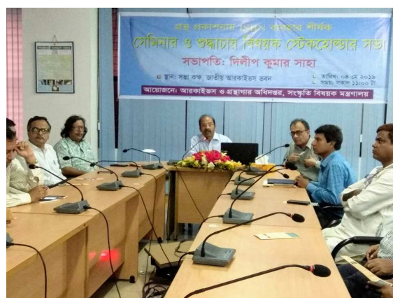
গ্রন্থ প্রকাশনায় ISBN ব্যবহার শীর্ষক সেমিনার ও শুদ্ধাচার বিষয়ক স্টেকহোল্ডার সভা ৪ মে ২০১৯