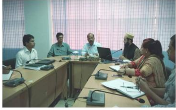
২৬ জুলাই ২০১৮ তারিখ আরকাইভস ও গ্রন্থাগার অধিদপ্তরের কর্মকর্তা ও কর্মচারীদের ই-ফাইল বিষয়ক আভ্যন্তরীণ প্রশিক্ষণ।