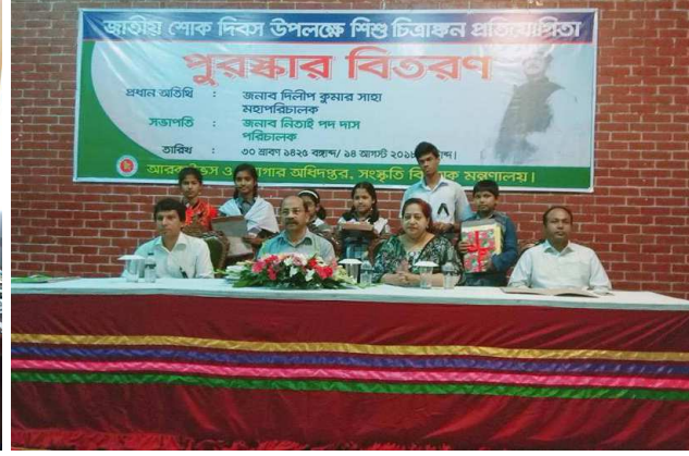
জাতীয় শোক দিবস উপলক্ষে শিশু চিত্রাঙ্কন প্রতিযোগিতায় বিজয়ীদের পুরস্কার প্রদান অনুষ্ঠান।