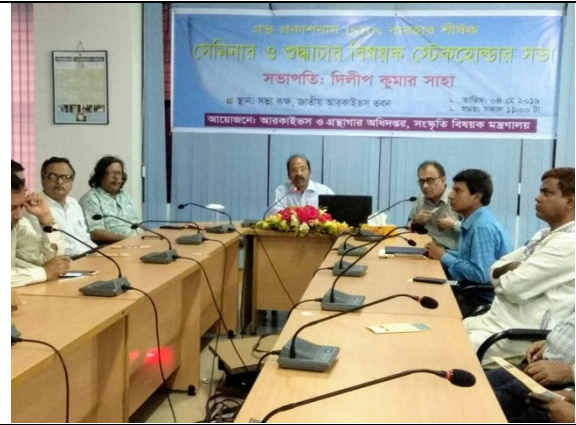
গ্রন্থ প্রকাশনায় আইএসবিএনি এর ব্যবহার শীর্ষক সেমিনার আয়োজন করা হয়।