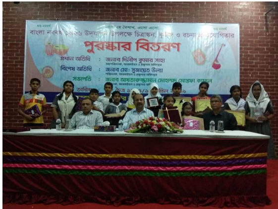
বাংলা নববর্ষ ১৪২৬ উপলক্ষে চিত্রাঙ্কন, কুইজ ও রচনা প্রতিযোগিতার আয়োজন করা হয়।