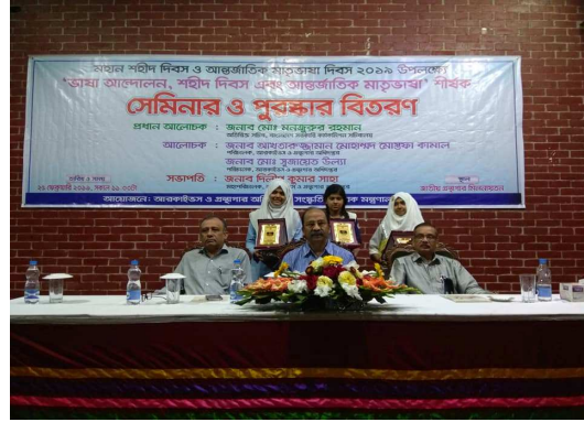
আন্তর্জাতিক মাতৃভাষা দিবস উপলক্ষে সেমিনার ও রচনা প্রতিযোগিতার পুরস্কার বিতরণী অনুষ্ঠান।