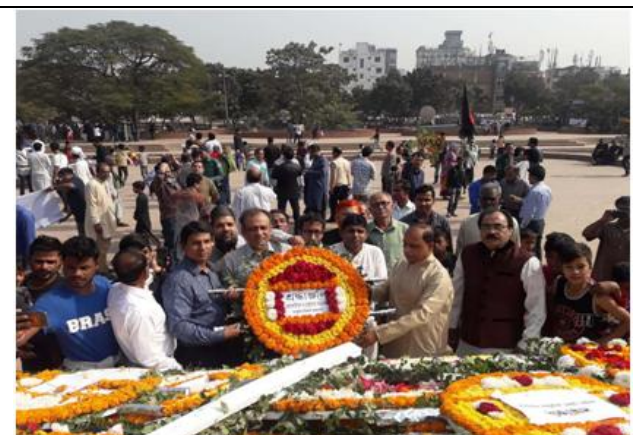
১৪ ডিসেম্বর ২০১৮ শহীদ বুদ্ধিজীবী দিবসে রায়েরবাজার বধ্যভূমিতে শ্রদ্ধাঞ্জলি অর্পণ।