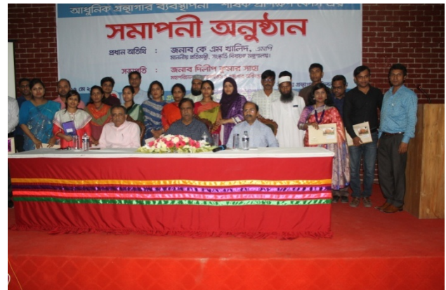
“ডিজিটাল/আধুনিক গ্রন্থাগার ব্যবস্থাপনা” শীর্ষক প্রশিক্ষণ কোর্সের প্রশিক্ষণার্থীগণ। [ ৫ মে ২০১৯]

৬০ ঘণ্টা প্রশিক্ষণ কর্মসূচির আওতায় অধিদপ্তরের কর্মকর্তা/কর্মচারীদের বিষয়ভিত্তিক অভ্যন্তরীণ প্রশিক্ষণ অনুষ্ঠিত