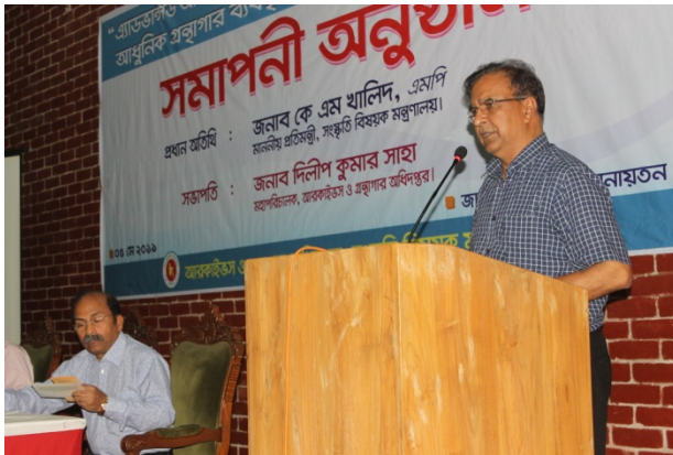
প্রধান অতিথির বক্তৃতা করছেন সংস্কৃতি বিষয়ক মন্ত্রণালয়ের মাননীয় প্রতিমন্ত্রী জনাব কে এম খালিদ, এমপি।[৫ মে ২০১৯]