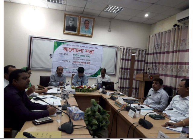
১৫ অক্টোবর ২০১৮ তারিখে রংপুর বিভাগীয় কমিশনারের কার্যালয়ে “আরকাইভাল রেকর্ড সৃষ্টি, সংরক্ষণ এবং ব্যবহার” শীর্ষক আলোচনা সভায় প্রধান অতিথির বক্তৃতা করছেন অধিদপ্তরের মহাপরিচালক।