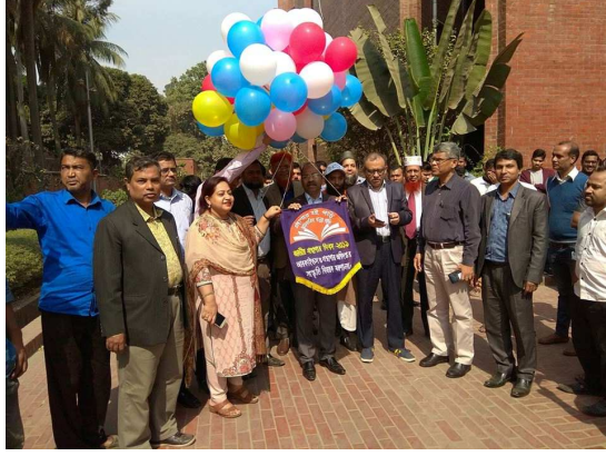
৫ ফেব্রুয়ারি ২০১৯ জাতীয় গ্রন্থাগার দিবস উদযাপন করা হয়।