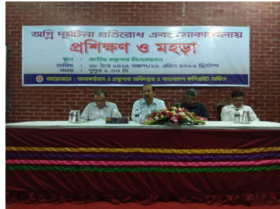
আরকাইভস ও গ্রন্থাগার অধিদপ্তরের আয়োজনে অগ্নি দুর্ঘটনা প্রতিরোধ এবং মোকাবেলায় প্রশিক্ষণ ও মহড়া অনুষ্ঠিত হয়।